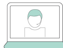
Servicio al cliente