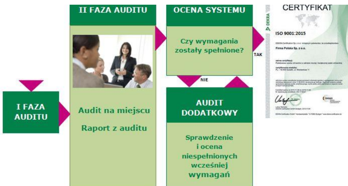
Rys. 2. Proces certyfikacji systemu zarządzania jakością wg ISO 9001:2015 w DEKRA Certification.

Jeżeli podczas auditu certyfikacyjnego zostaną stwierdzone niezgodności to certyfikat może być przyznany po pierwsze gdy wszystkie niezgodności zostaną usunięte. Rezultat auditu jest udokumentowany w raporcie z auditu. Raport ten jest podstawą do podjęcia decyzji przez Komitet Certyfikacyjny DEKRA o wydaniu certyfikatu.