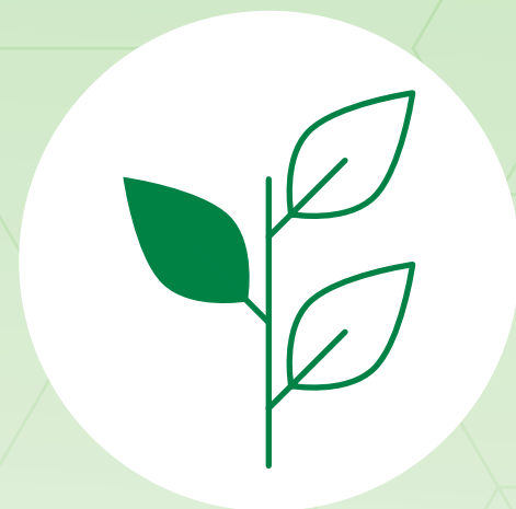
Lebensmittel- und Futtermittelwirtschaft