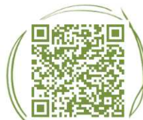
Google Play Store

Sie zeigt dir die nächsten Haltestellen und weiß dank Echtzeit-Daten auf die Minute genau, wann der nächste Bus oder Zug auch tatsächlich kommt. Einfach Standort freigeben und lotsen lassen! Als App oder WebApp immer dabei!