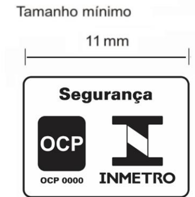
Figura 2 - Selo de Identificação da Conformidade compacto para o produto

1.3 Os produtos certificados de acordo com o modelo Situação para Produto Importado (SPI) devem ostentar no Selo, além do número do Certificado de Conformidade, a versão em idioma português de todas as advertências exibidas, principalmente quando existir requisito especial de instalação no certificado original.