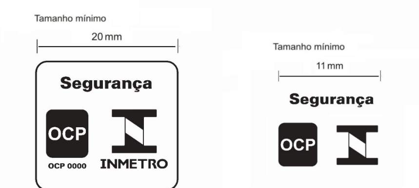
Figura 2 – Selo de Identificação da Conformidade compacto

2. Caso as dimensões do aparelho eletrodoméstico não permitam a aplicação do Selo de Identificação da Conformidade completo, conforme a Figura 1, o Selo de Identificação da Conformidade compacto pode ser apostado, conforme a Figura 2, devendo o mesmo ser legível e indelével e obedecendo aos tamanhos mínimos estabelecidos.